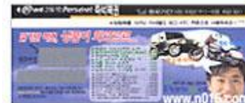
KTF "퍼스넷 즉석복권"