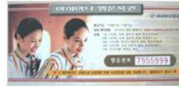
아시아나 항공 "아시아나 행운복권"