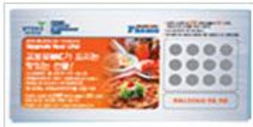
교보 자동차보험 UMC 서비스 - FOOD, 영화, 공연

재미있는 스크래치 복권으로 트윈콤보세트를 드리는 이벤트 기획, 제작, 운영