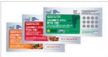
SSL 추출물 Sweepstake 방식의 쿠폰을 활용하여 고객의 흥미를 유발하고 다양한 고품격 서비스를 제공할 수 있는 Fun 마케팅 기획 운영