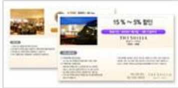
웅진 코웨이 PayFree 할인서비스