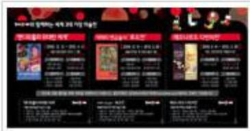
통신사 멤버십 미술 전시회 초대 이벤트 KT SHOW 와 함께하는 세계3대 거장 미술전 기획 운영