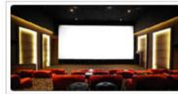
영화시사회 이벤트 메이저급 영화 시사회를 통한 회원유치 문화마케팅 기획 운영