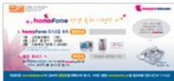
하나로통신 하나폰 탄생기념 즉석복권

재미있는 스크래치 복권으로 영화 · 공연무료 관람, 무료시식의 행운을 드리는 이벤트 기획, 제작, 운영