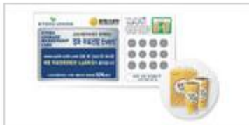
교보 자동차보험 UMC 서비스