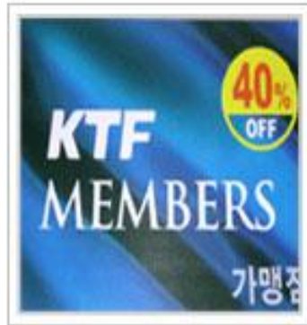
홍보용 스티커 제작